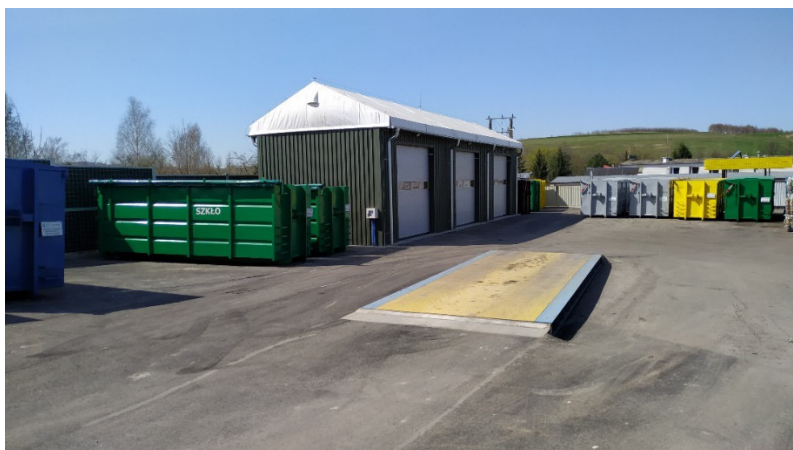
Rysunek nr 3. Punkt Selektywnej Zbiórki Odpadów Komunalnych w Białowej

3. Możliwości przetwarzania niesegregowanych (zmieszanych) odpadów komunalnych, bioodpadów stanowiących odpady komunalne oraz przeznaczonych do składowania pozostałości z sortowania odpadów komunalnych i pozostałości z procesu mechaniczno-biologicznego przetwarzania niesegregowanych (zmieszanych) odpadów komunalnych.