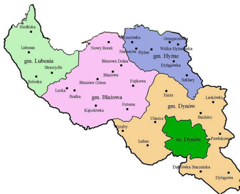
Rysunek nr 1. Obszar Celowego Związku Gmin „Eko-Logiczni”