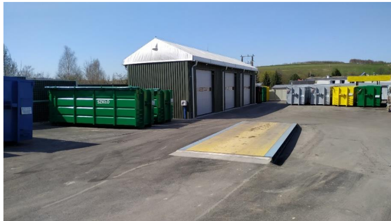
Rysunek nr 3. Punkt Selektywnej Zbiórki Odpadów Komunalnych w Błazowej