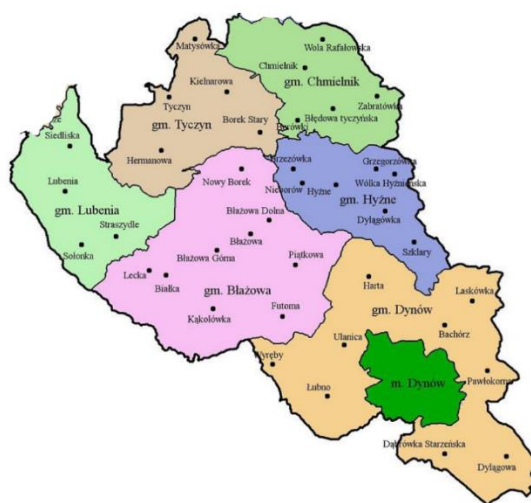
Rysunek nr 1. Obszar Celowego Związku Gmin „Eko-Logiczni”